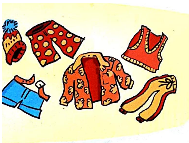
Mon vêtement préféré